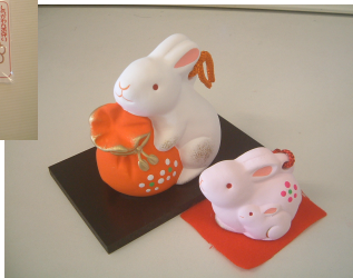
干支土鈴/大 1,000円、小 500円

※お守りの授与時間は、表面祈禱受付時間内です。 1月3日以降のお守り授与は、午後4時30分終了です。