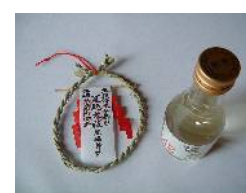
夏越大祓参列者授与品 (茅の輪守り、お神酒)